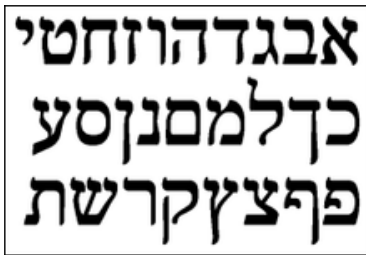
Das hebräische Alphabet (von rechts nach links zu lesen)