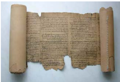
Der berühmteste Fund aus Qumran: Die Jesajarolle, 7,35 Meter lang

Am Anfang des Alten Testaments wird über die _____ und den _____ berichtet. Danach wird die Geschichte von Gottes auserwähltem Volk Israel – den Juden – geschildert. Hier werden die Folgen der Sünde deutlich. Die anfangs gute Beziehung zwischen Gott und den Menschen ist nun zerstört. Immer wieder wird das Volk Israel Gott ungehorsam, so dass Gott es durch die Propheten ermahnen oder durch fremde Völker sogar bestrafen muss. Trotzdem ist Gott den Juden in seiner Liebe immer treu zur Seite gestanden und hat ihnen seine Vergebung angeboten.