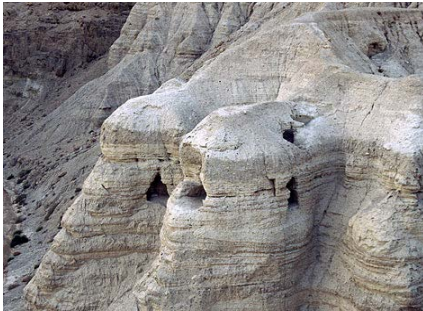
Die Höhlen von Qumran

Bibel immer wieder von Hand abgeschrieben. Um keinen Fehler zu machen, haben sie jedes Wort einzeln nachgezählt.