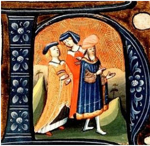
Elkana, Hanna und Peninna (mittelalterliche Handschrift)

Schauen wir uns zwei Beispiele an. Was hat Hanna und Samuel gekränkt und wie haben sie reagiert?