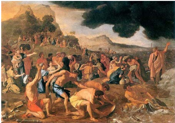
Mose und die Israeliten durchqueren das Rote Meer (Bild von Nicholas Poussin, 1634)

Was steht in den fünf Büchern Mose? Versuche die untenstehenden Themen einem der fünf Teile des Buches zuzuordnen. Am besten orientierst du dich an einem Inhaltsverzeichnis oder du blätterst die Seiten durch und achtest dabei auf die Titel der einzelnen Kapitel.