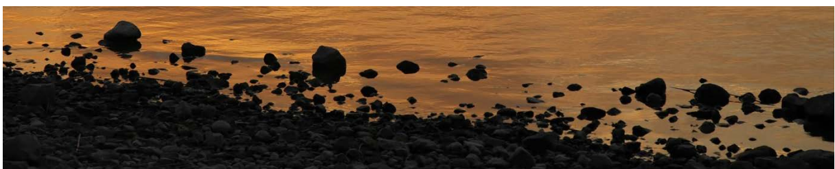
Impression vom Ufer des Galiläischen Meeres (= See Genezareth)