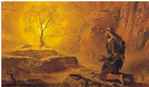
Mose vor dem brennenden Dornbusch

Die fünf Bücher Mose berichten von der Erschaffung der Welt durch Gott bis zur bevorstehenden Eroberung des verheissenen Landes durch Israel. Wie das Volk Gottes dieses Gebiet eingenommen hat, wird dann im Buch Josua beschrieben.