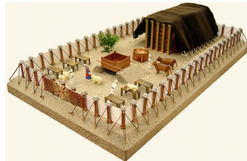
Die Stiftshütte, am Sinai erbaut

Die Erzväter, auch Patriarchen genannt, sind jene Männer, von denen das Volk Israel abstammt.