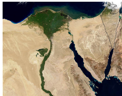
Ägypten und die Sinaihalbinsel

dern um eine „Gesetzeswiederholung“. Das Buch enthält nämlich fast ausschliesslich Reden von Mose. Kurz vor seinem Tod erinnert er das Volk Israel an die Anweisungen Gottes und bereitet es so auf den Einzug ins verheissene Land unter Josua vor.