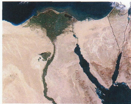
Ägypten und die Sinaihalbinsel