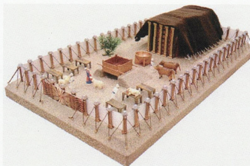
Die Stiftshütte, am Sinai erbaut

Die Erzväter, auch Patriarchen genannt, sind jene Männer, von denen das Volk Israel abstammt.