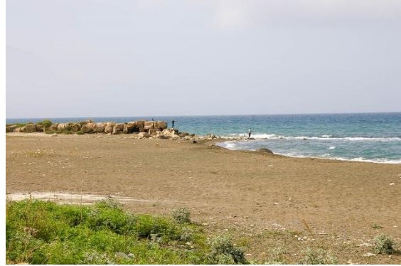
Überreste des Hafens Seleucia

Weshalb ist die Gemeinde Antiochia in die Geschichte eingegangen (V. 26)?