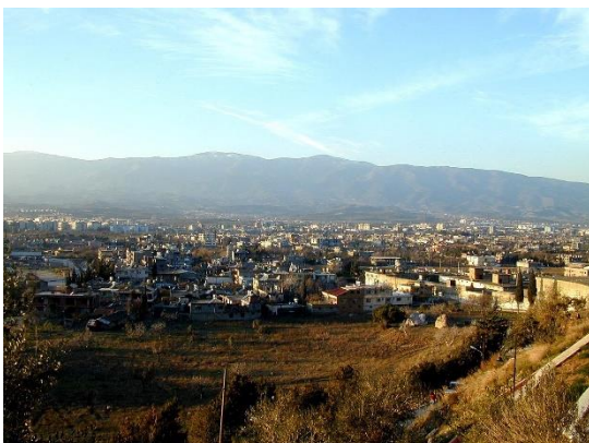
Die heutige Stadt Antakya

Was wird den Griechen verkündigt (V. 20b)?