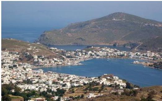
Die Insel Patmos

Aufgabe: Lies Offb 1,1-11 und versuche, die untenstehende Liste auszufüllen.