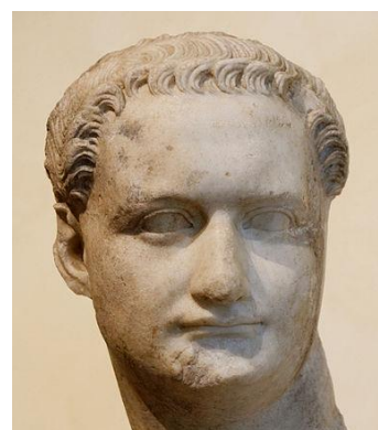
Kaiser Domitian (81-96 n. Chr.)

Die Offenbarung wurde von _____ geschrieben, der auch ein _____ und drei _____ verfasst hat. Am Ende seines Lebens wurde er wegen seines Glaubens an Jesus Christus auf die Insel _____ verbannt. Irenäus, der im 2. Jahrhundert lebte, berichtet uns, dass die Offenbarung am Ende der Regierungszeit Domitians geschaut wurde. Domitian war ein römischer Kaiser, der von 81 bis 96 n. Chr. regiert hat. Somit dürfte die Offenbarung um 94/95 n. Chr. geschrieben worden sein. Kaiser Domitian liess in jener Zeit die Christen verfolgen.