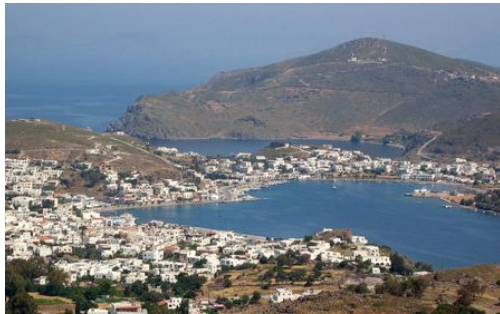
Die Insel Patmos

Aufgabe: Lies Offb 1,1-11 und versuche, die untenstehende Liste auszufüllen.