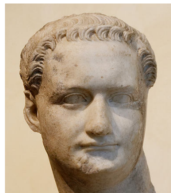
Kaiser Domitian (81-96 n. Chr.)

Die Offenbarung wurde von _____ geschrieben, der auch ein _____ und drei _____ verfasst hat. Am Ende seines Lebens wurde er wegen seines Glaubens an Jesus Christus auf die Insel _____ verbannt. Irenäus, der im 2. Jahrhundert lebte, berichtet uns, dass die Offenbarung am Ende der Regierungszeit Domitians geschaut wurde. Domitian war ein römischer Kaiser, der von 81 bis 96 n. Chr. regiert hat. Somit dürfte die Offenbarung um 94/95 n. Chr. geschrieben worden sein. Kaiser Domitian liess in jener Zeit die Christen verfolgen.