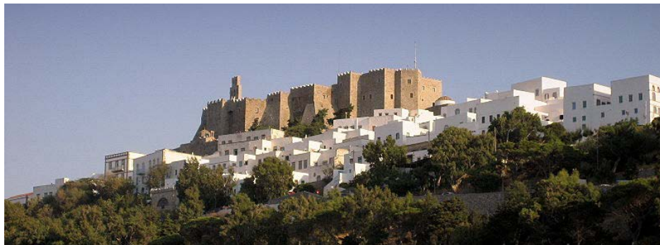
Das St. Johannis-Kloster auf Patmos