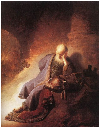
Jeremia beklagt die Zerstörung Jerusalems (Rembrandt, 1630)

Manchmal werden die Klagelieder nicht zu den poetischen Büchern gezählt, da sie in der deutschen Bibel getrennt von den anderen fünf Werken zwischen den Propheten Jeremia und _____ eingereiht sind. Doch wie der Name es bereits sagt, handelt es sich auch bei diesem Buch um eine Sammlung von Liedern.