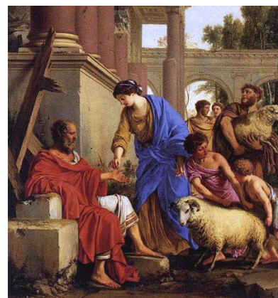
Hiob erhält seinen Wohlstand zurück (Laurent de La Hyre, 1648)

Das erste poetische Buch der Bibel erzählt die Geschichte derjenigen Person, die diesem Buch den Namen gegeben hat: _____. Die Einleitung und der Schlussteil der Erzählung sind nicht in Gedichtform, sondern in _____ (= Erzählform) abgefasst. Doch beim langen Mittelteil - den Gesprächen zwischen Hiob, seinen _____ und Gott - handelt es sich um Gedichte, die zu den besten Werken der Weltliteratur gehören.