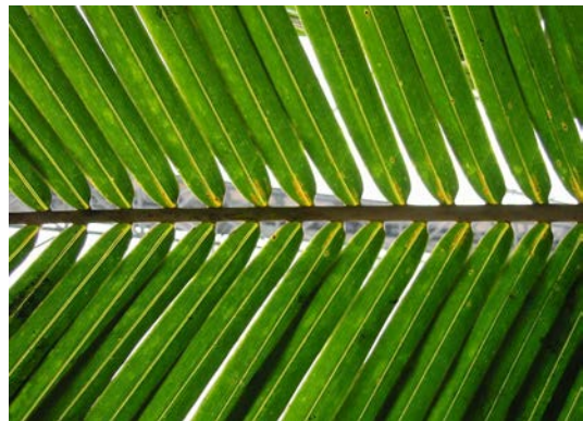
Palmwedel (CC-BY 2.0)

Sie fallen nieder, beten an, loben Gott und danken ihm für das Heil. _____