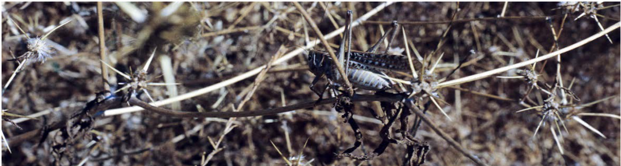
Heuschrecke in einem verdorrten Geäst bei Silo

Erläuterungen: Vieles spricht dafür, dass mit den Heuschrecken nicht Tiere, sondern Dämonen, d.h. gefallene Engel gemeint sind: Sie kommen aus dem Abgrund. Kommt dieses Wort in der Offenbarung vor, so bezeichnet es stets den Aufenthaltsort gefallener Engel (vgl. Offb 9,2.11; 11,7; 17,8; 20,1.3). Ausserdem können Heuschrecken nicht wie Skorpione stechen. Auch haben sie keinen König bzw. keine Königin wie andere Insekten. Und: Die hier erwähnten Wesen fressen das Grüne nicht. Das Bild der Heuschrecken wird für die Dämonen verwendet, weil sie wie Heuschreckenschwärme in grosser Zahl ausschwärmen und in kürzester Zeit alles vernichten.