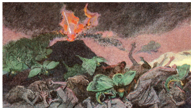
Der Abgrund öffnet sich (Offb 9,1-2) Gebhard Fugel (1933)