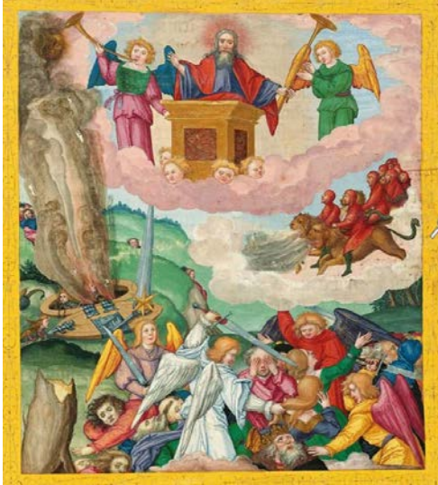
Die Posaunen 5 und 6

Illustration aus der Ottheinrich-Bibel (15./16. Jh.)