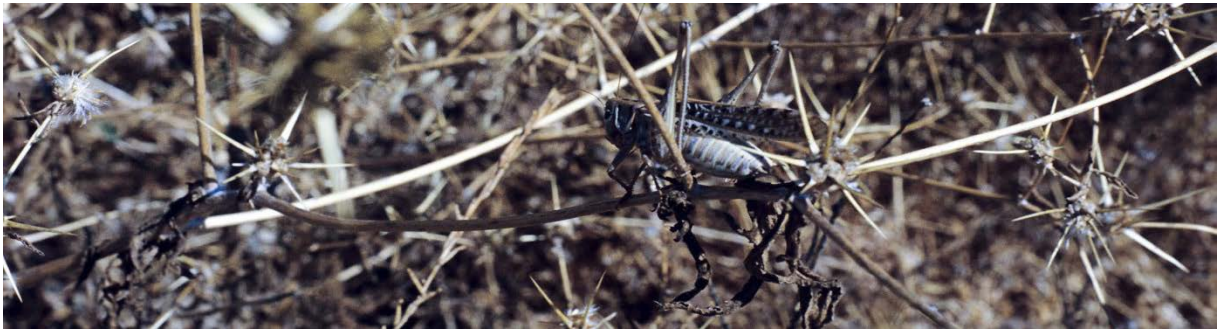
Heuschrecke in einem verdorrten Geäst bei Silo

Erläuterungen: Vieles spricht dafür, dass mit den Heuschrecken nicht Tiere, sondern Dämonen, d.h. gefallene Engel gemeint sind: Sie kommen aus dem Abgrund. Kommt dieses Wort in der Offenbarung vor, so bezeichnet es stets den Aufenthaltsort gefallener Engel (vgl. Offb 9,2.11; 11,7; 17,8; 20,1.3). Ausserdem können Heuschrecken nicht wie Skorpione stechen. Auch haben sie keinen König bzw. keine Königin wie andere Insekten. Und: Die hier erwähnten Wesen fressen das Grüne nicht. Das Bild der Heuschrecken wird für die Dämonen verwendet, weil sie wie Heuschreckenschwärme in grosser Zahl ausschwärmen und in kürzester Zeit alles vernichten.